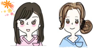
まつぎき りょう *かふんしょう よしだ あいみ *おはなみ